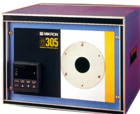
M305 型 100~1000℃