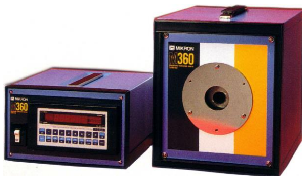
M360 型 50~1100℃