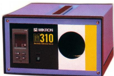
M310HT 型 室温+5~450℃