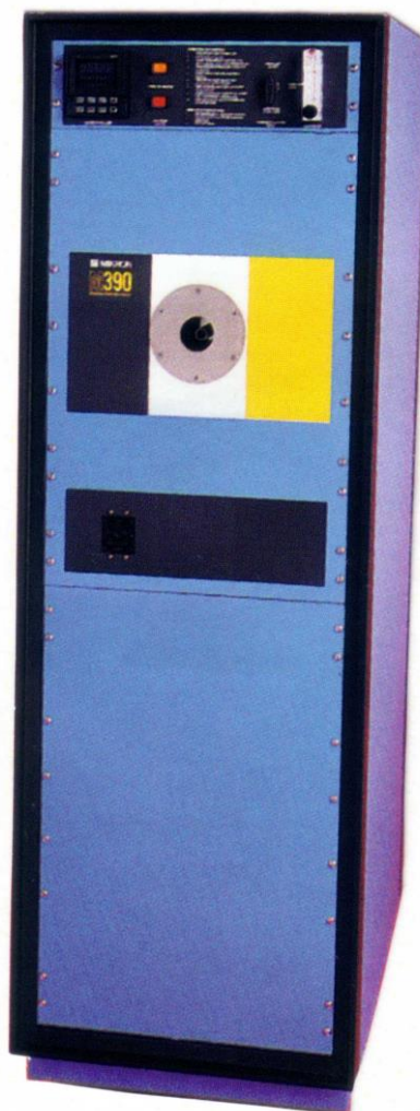
M390-A,B,C 型 600~3000℃