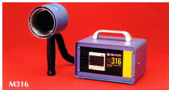
M316 型 現場持込型 室温+5~300℃