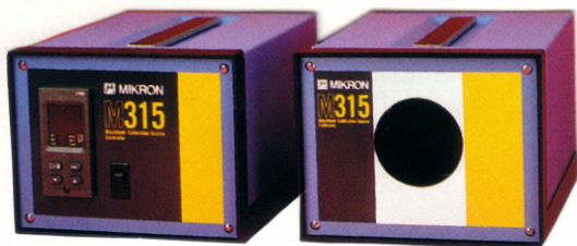
M315HT 型 炉体・制御箱分離型 室温+5~450℃