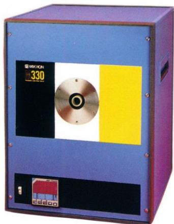
M330 型 300~1700℃