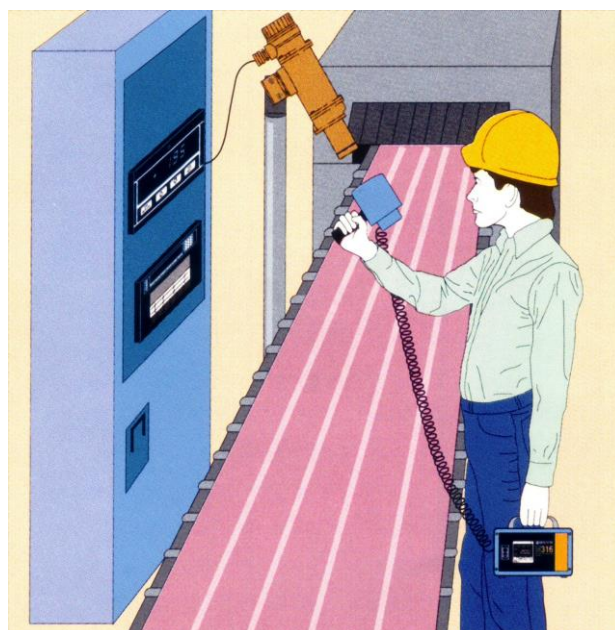
M316 型 使用例