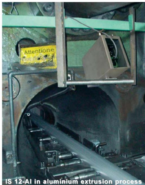
IS 12-AL in aluminium extrusion process

IS12-ALは、IS10-ALでの経験をもとに温度範囲を350~1050°Cのアルミ温度測定用として特別に開発されました。従来の放射温度計では、2色式でさえ、アルミの温度を正確に測定することは困難でした。それは、アルミが示す低放射率という物理的な性質のためでした。IS12-ALでは、近赤外の狭波長を使用しています。この波長範囲では、固体のアルミニウムは、放射率は、30~43%と高く安定な値をとります。